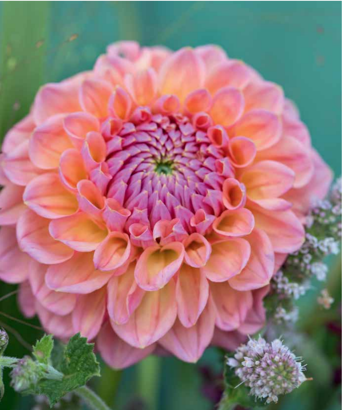
'Linda's Baby'. 'Labyrinth'. >