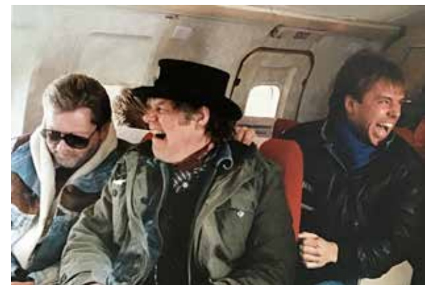
Højt humør i flyet på vej til Grønland, 1987.