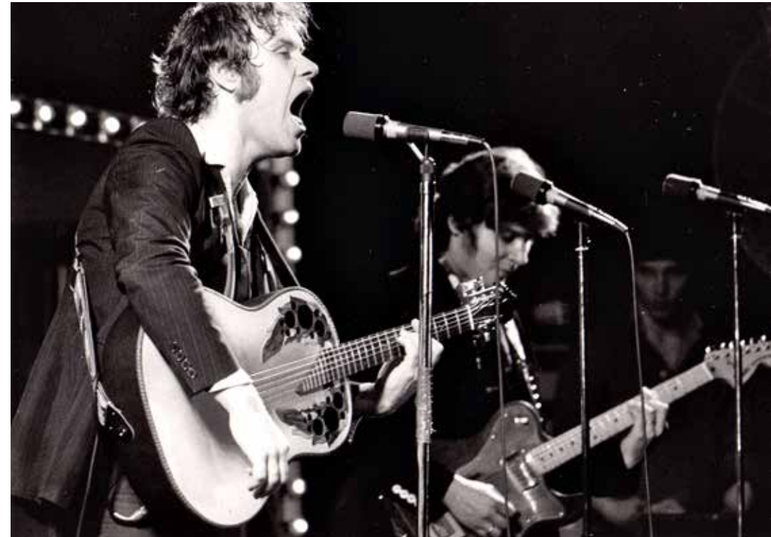
Kim og Thomas Grue i Tivolis Koncertsal under Personnummer-turen i 1980.

Tilbage til sangeren. Kim sang aldrig falsk. Noget har vi fået i vuggegave, resten er hårdt arbejde, og hvad Kim angik, stod stemmebåndene sjældent stille. Han var altid i gang med en eller anden idé. Ikke nødvendigvis en brugbar idé, men blot det at være