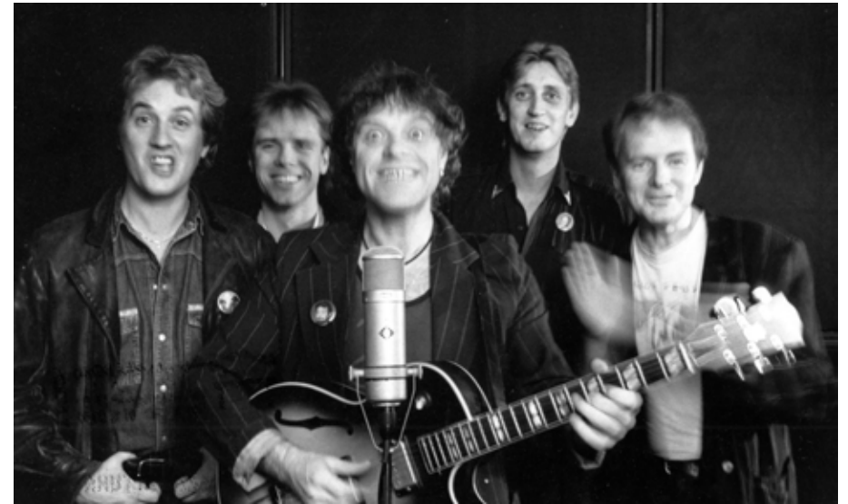
Kim Larsen og Bellami under indspilning af Kielgasten i Medley-studiet.