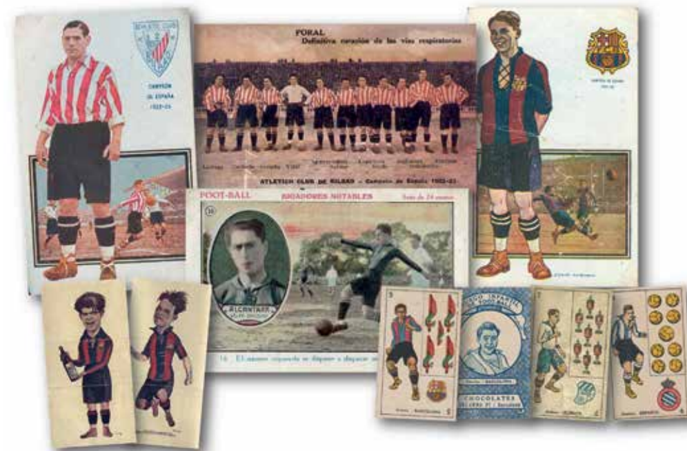
I 1920'erne fik fodbold stor udbredelse i Spanien, og de bedste spillere blev offentligt kendte personer. De blev brugt i reklamer – som her for vidundermidlet Poral mod problemer i luftvejene – og spillerne udkom på samlekort i chokoladepakker.

Resultaterne på fodboldbanen afspejler polariseringen mellem regionerne og centrum i Madrid. Medregner man Copa de la Coronación i 1902, vandt Barcelona frem til 1928 turneringen syv gange, Madrid vandt fire gange i træk fra 1905 til 1908 og en gang mere i 1917, men med ti sejre og fem an-