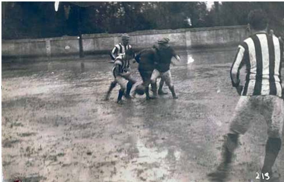
Det er svært at spille poleret fodbold i regnvej. Derfor udviklede man tidligt en fysisk betonet spillestil i Baskerlandet.

Antonio Machado, Pío Barojas og Miguel de Unamuno vendte ryggen til den ukritiske religiøsitet og banede i stedet vejen for rationalitet og modernisme. Den nye, moderne livsform omfattede efter filosofen Unamunos mening ikke fodbold, som han anså for at være en uciviliseret tvekamp fra en mørk, barbarisk fortid: "Brød og tyrefægtning har holdt folket fanget i sin grotte! Nu hedder det brød og bold!" Det er derfor skæbnens ironi, at Unamuno – som i øvrigt var grandonkel til Athletic Clubs topscorer omkring Første Verdenskrig, Pichichi – i nyere tid har fået opkaldt en fodboldklub efter sig i en landsby lidt uden for Sevilla.